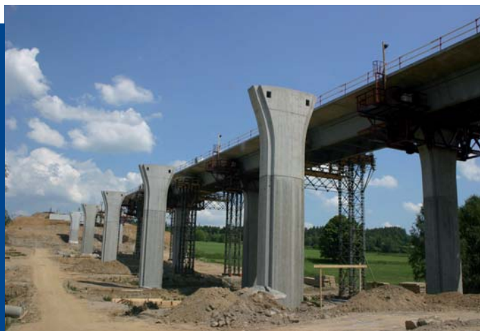
↑ Výsuv nosné konstrukce estakády Pzavá