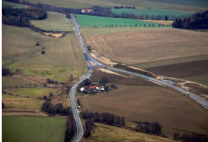
↑ Napojení úseku na silnici I/3 u Nové Hospody