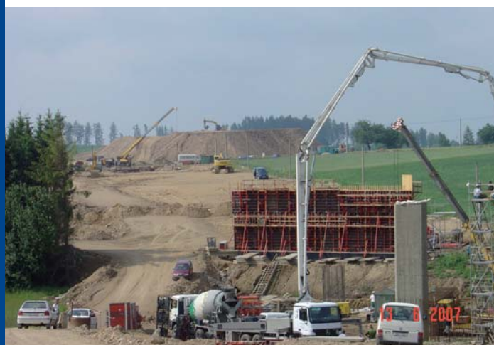
↑ Pohled na staveniště 0305-II, I. etapa, léto 2007